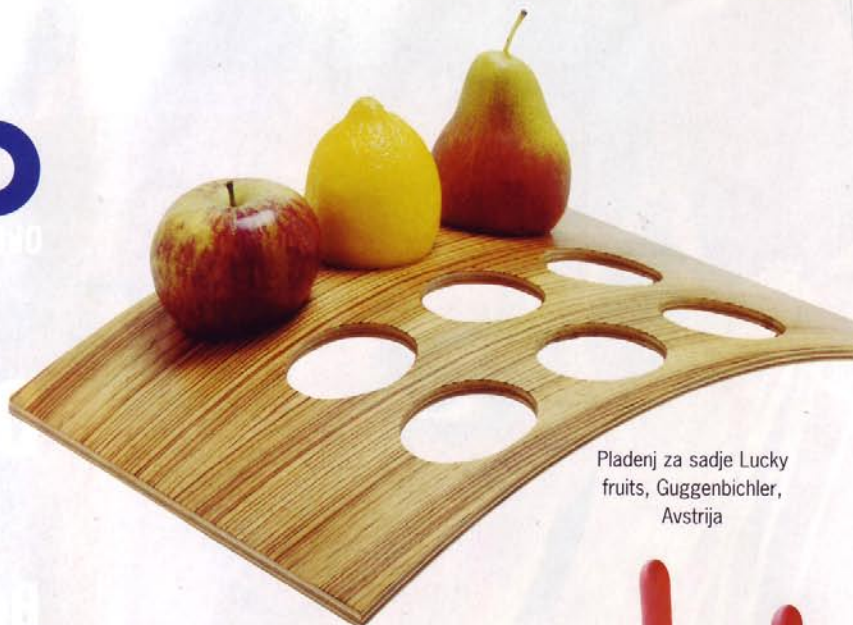
Pladenj za sadje Lucky fruits, Guggenbichler, Avstrija