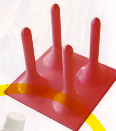
Sušilnik steklenic, Katarina Zahoránská, Slovaška

Vzemite si čas in si vse do 15. oktobra na Fužinskem gradu oglejte ustvarjalne, nenavadne, uporabne in zelo zanimive izdelke, ki jih razstavljajo oblikovalci iz trinajstih držav na 19. bienalu industrijskega oblikovanja.